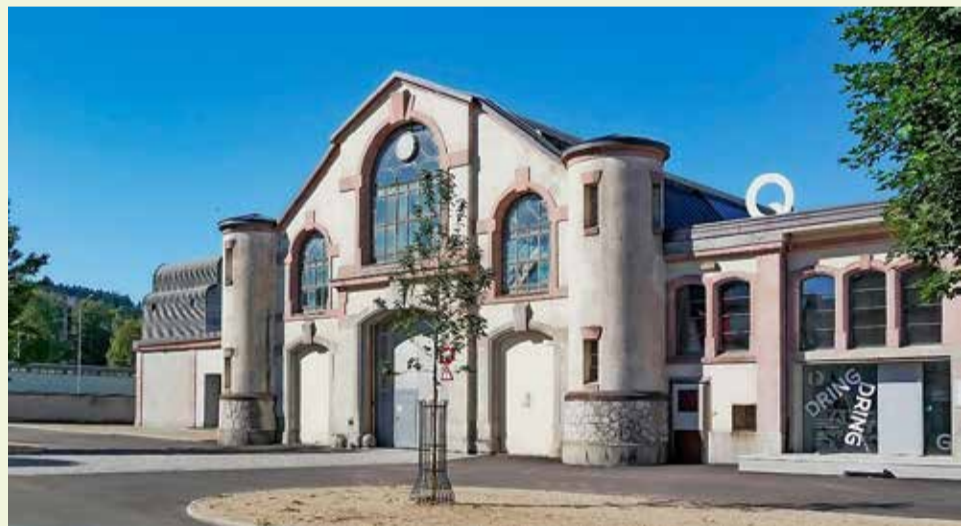
VILLE DE LA CHAUX-DE-FONDS